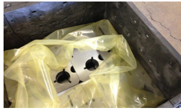
Bolsa Con Fuelle VCI de ZERUST®