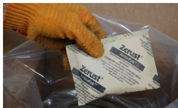
ActivPak® Difusor VCI De Rápida Acción De ZERUST®