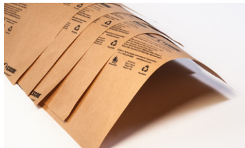
Lienzos De Papel Kraft VCI De ZERUST®