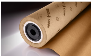
Papel Kraft VCI De ZERUST®