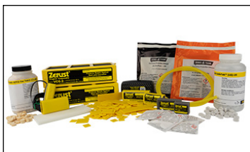
Difusores De Vapor VCI de ZERUST®