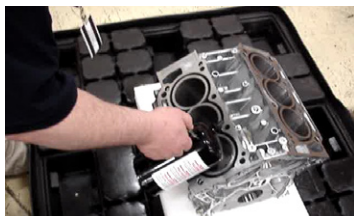
Recubrimiento Base Aceite En Aerosol VCI De ZERUST®